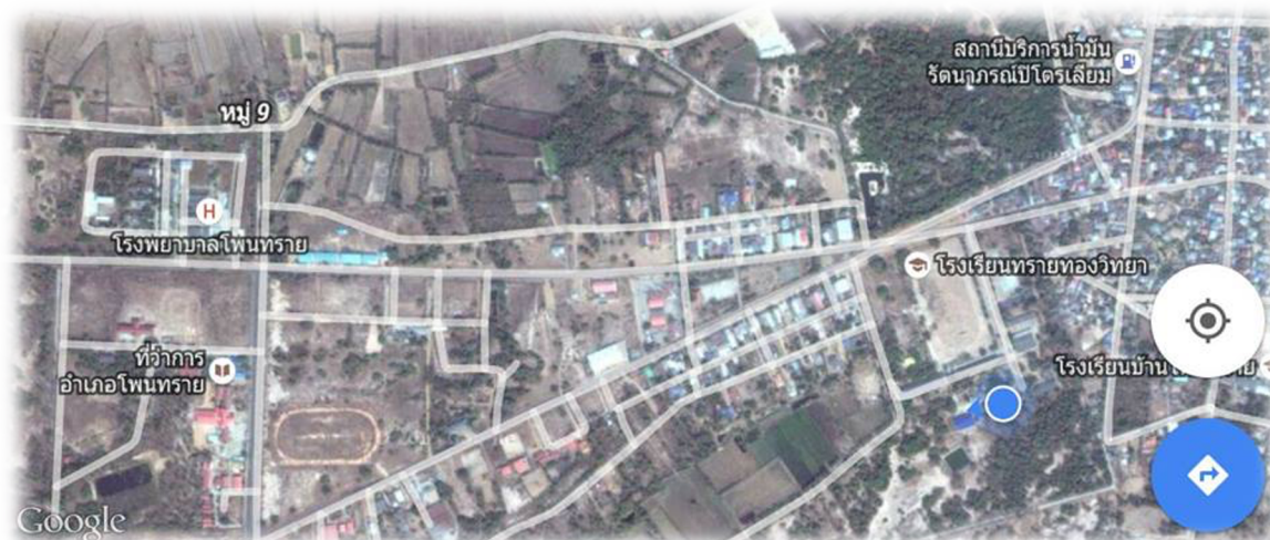
ภาพที่ ๖ ภาพแผนที่ที่ตั้งโรงเรียนทรายทองวิทยา