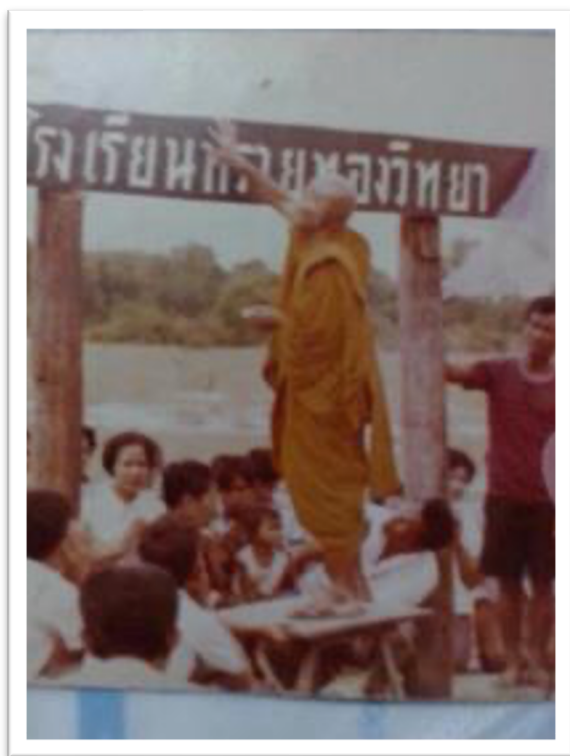
ภาพที่ ๑ วันสถาปนาโรงเรียนทรายทองวิทยา