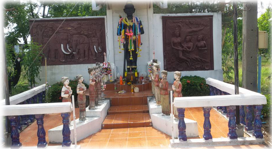
ภาพที่ ๒ รูปปั้นท้าวคันธนาม