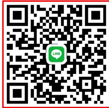
กลุ่ม ม. 2