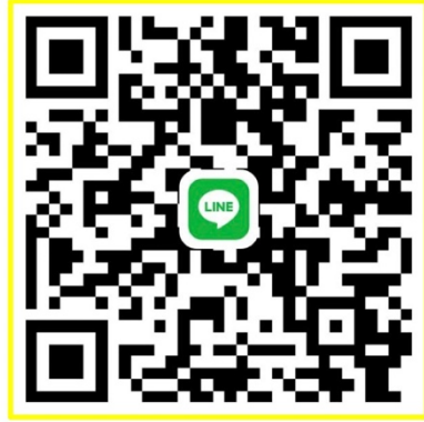
กลุ่ม ม. 4