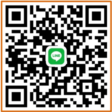
กลุ่ม ม. 5