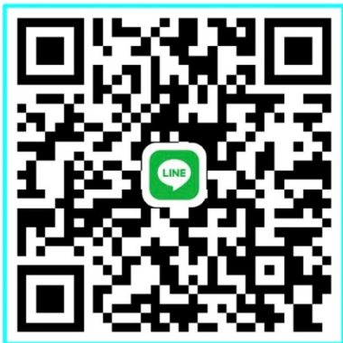
กลุ่ม ม. 3