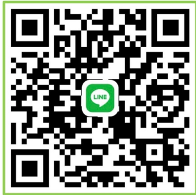
กลุ่ม ม. 1