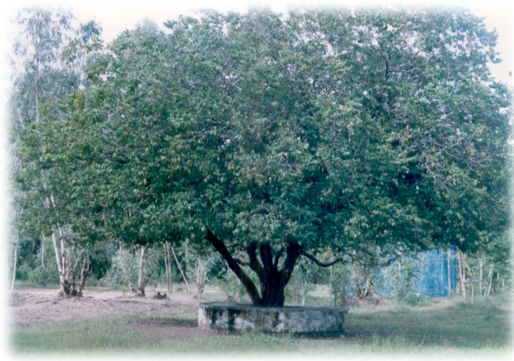
ภาพที่ ๔ ภาพต้นเม็ก