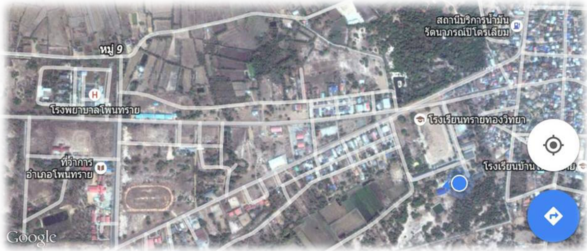
ภาพที่ ๖ ภาพแผนที่ตั้งโรงเรียนทรายทองวิทยา