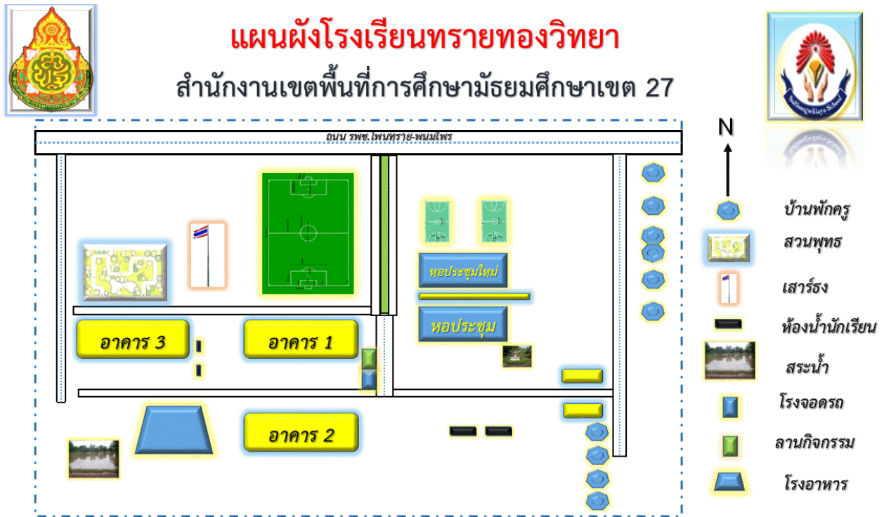
ภาพที่ ๗ ภาพแผนโรงเรียนทรายทองวิทยา