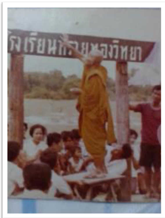
ภาพที่ ๑ วันสถาปนาโรงเรียนทรายทองวิทยา