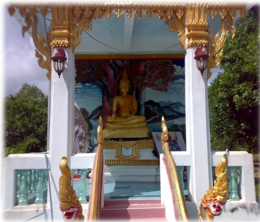
ภาพที่ ๓ ภาพพระพุทธรังสีทรายทอง