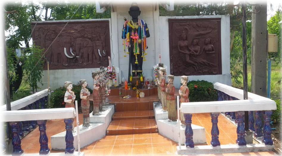
ภาพที่ ๒ รูปปั้นท้าวคันธนาม